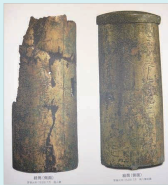
氏綱室養珠院の経筒