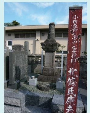
氏康室瑞溪院の墓と顕彰碑 (善栄寺)