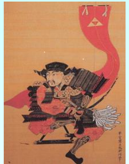
井原市法泉寺・蔵