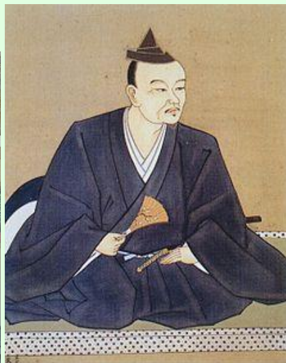
北條氏綱画像 (小田原城天守閣・蔵)