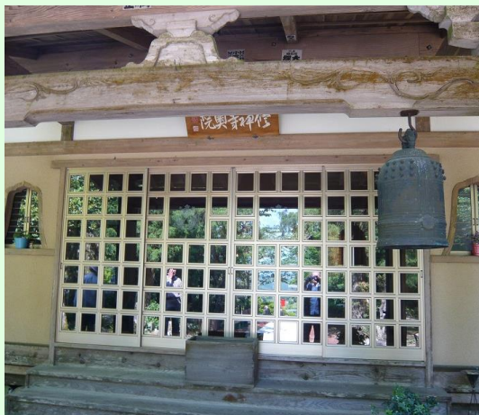
修禅寺奥の院正覚院