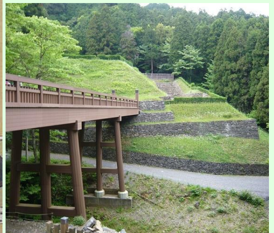
八王子城跡御主殿引橋