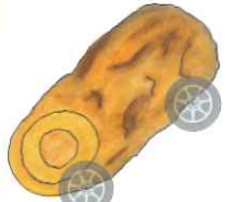
地あじ雑魚ちくわ