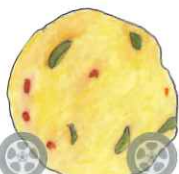
ゆず入りソフト鶏つみれ