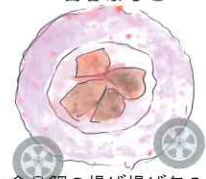
金目鯛の揚げ揚げ包み