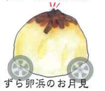
うずら卵浜のお月見