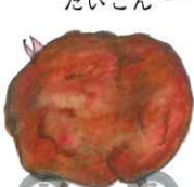
地鶏入り揚げつくね