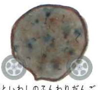
鰻といわしのふんわりだんご